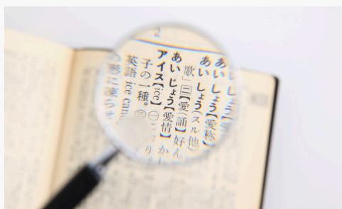
Traducciones no juradas.