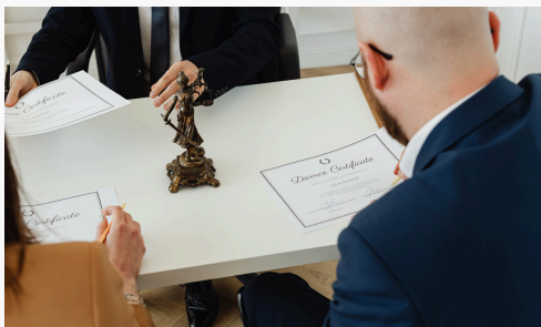
Certificados caducados o mal legalizados.